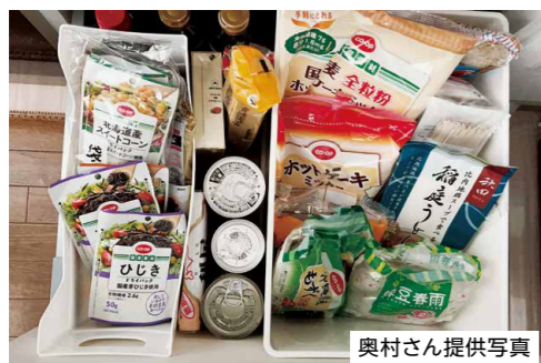
▲缶詰や乾物など、食べ慣れたものが非常食に

我が家では、普段食べているもので、常温保存できる食品を常に2つ買い置き。1つ使ったら1つ買い足すだけで、賞味期限切れを気にせず備蓄できます。